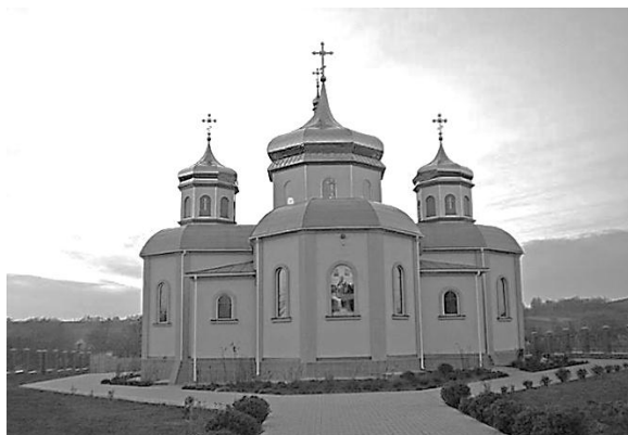
Мліївська Успенська церква

с. 9-11]. Таким чином в літописі та пізніших історичних документах згадуються хани Томглії та Ітомглії.