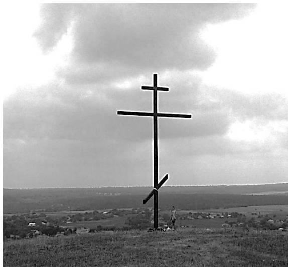
Могила-оберіг на найвищій горі села Млієва

ївський «ключ», Конєцпольські почали визначати його межі і намагалися загарбати як найбільше сусідніх земель[8, с. 50]. 1648 року Млієвом оволоділи війська Богдана Хмельницького і він став ранговим містечком гетьмана, а невдовзі – центром Мліївської сотні Корсунського полку [9, с.6-8].